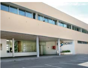
IES BENDINAT Calvià - Mallorca 2006