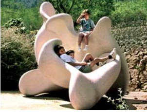
FUNDACIÓN DE ARTE SERRA Ses Tanques - Sòller Mallorca 1995