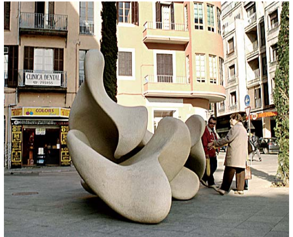
Este grupo escultórico en piedra artificial representa el acoplamiento de dos Águilas, una reflejo especular de la otra.