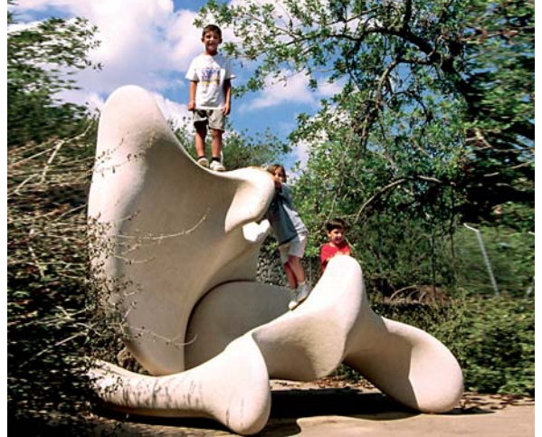
Este grupo escultórico representa el acoplamiento de dos Águilas, una igual a la otra.