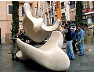
PLAZA ALEXANDRE JAUME Palma de Mallorca 2002