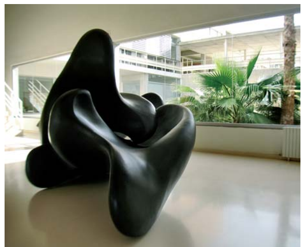
Estas dos Águilas, una igual a la otra, realizadas en fibra de vidrio, son ligeras y fácilmente movibles para conseguir diferentes composiciones.