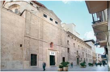
ESGLÉSIA DE SANT ANTONIET Palma de Mallorca 2001 / 2002

Partiendo de estas esculturas originales, concibió y realizó una instalación/experiencia en la iglesia de Sant Antoni en Palma de Mallorca, patrocinada por el Ayuntamiento de Palma, el Consejo de Mallorca, el Gobierno Balear y coordinada por NESHER.