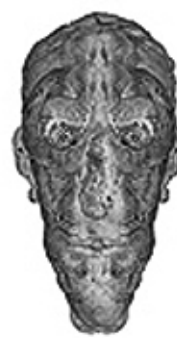
HANDSMATTER / QUIXOTESANCHO in ARGAMASILLA DE ALBA